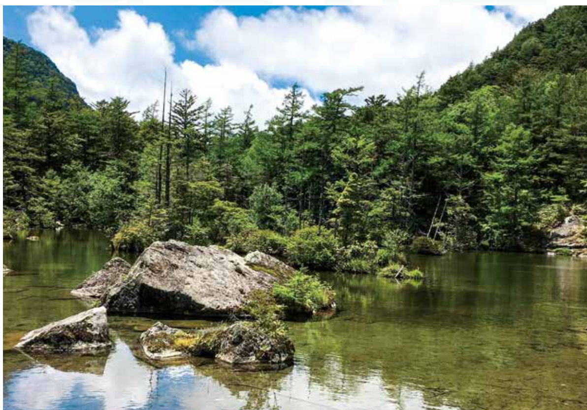
長野県上高地 明神池